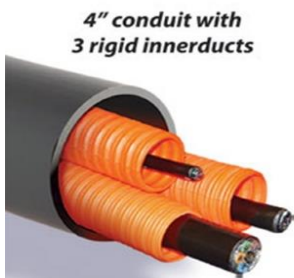
4" conduit with 3 rigid innerducts