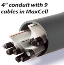
4" conduit with 9 cables in MaxCell