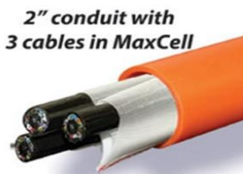
2" conduit with 3 cables in MaxCell