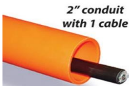
2" conduit with 1 cable

Rigid innerduct limitations 300% more cables with MaxCell